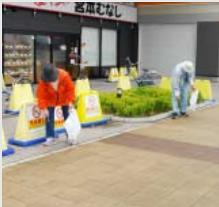
清掃ボランティア きれいな町は気持ちいい！