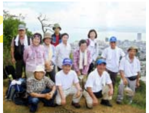
仲間といっしょに記念撮影・筆者前列中央

毎日散歩したり、山に登ったり、日常のストレスを忘れて頭の中を空っぽにする。これが私にとっての一番の健康法だと思います。