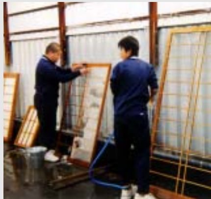
トライやる 障子のはりかえは難しいな