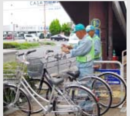
自転車指導業務 決めた場所においてね！