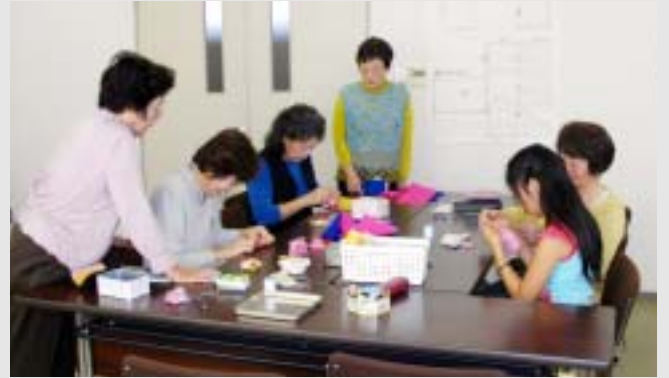
お手玉作り講習会 昔とった杵柄