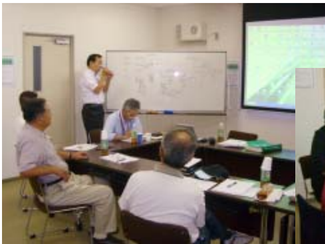
省エネルギーチームの経営コンサルタントによる研修模様

これからは、自分自身の生きがいを求めて省エネルギー診断・CO 2 削減提案の仕事をしてゆきたいと思います。