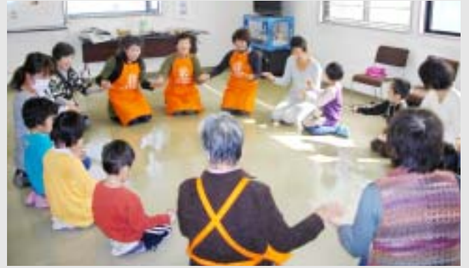
作って 遊んで つながって おばあちゃんの手あたたかい？