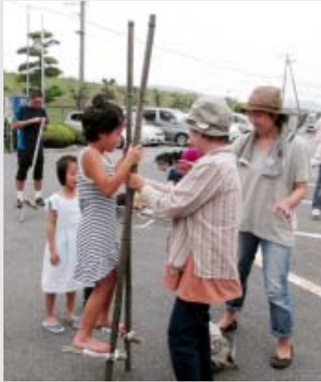
初めての竹馬うれしかった