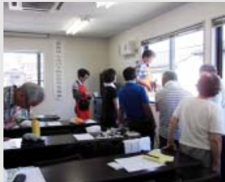
ハウスクリーニング実習 真剣そのもの