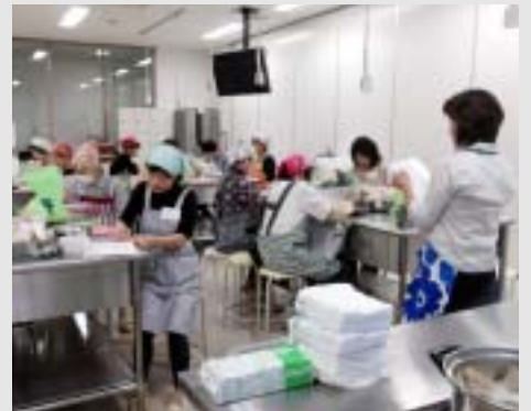
介護食作り おいしく出来ました