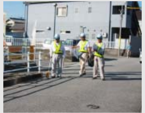
市道施設調査 ガードレールはだいじょうぶかな