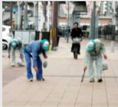
駅前きれいになりました