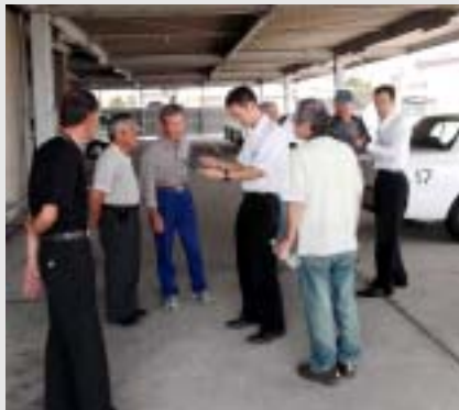
安全を心掛けて運転します