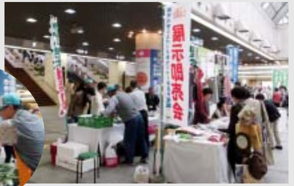
好評で売り上げは上々でした